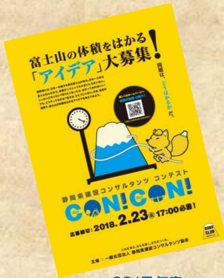
2017年度 CON:CON!コンテスト 富士山の体積をはかる アイデア募集！