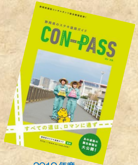
2019年度 CON-PASS すてきな道路ガイド