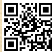
協会ホームページ