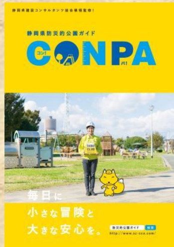
2018年度 CONPA 防災的公園ガイド