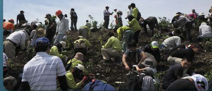
「希望の森づくりプロジェクト」による植樹ボランティア活動