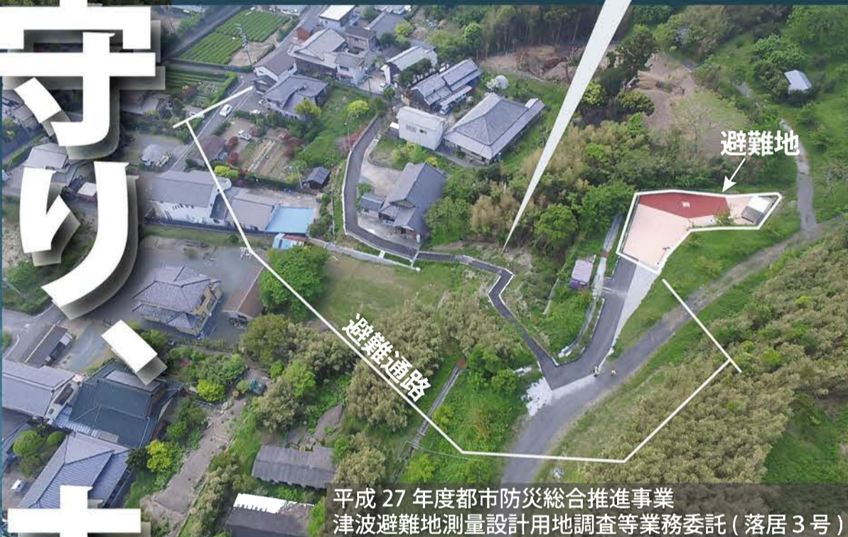
平成 27 年度都市防災総合推進事業 津波避難地測量設計用地調査等業務委託 (落居 3 号)