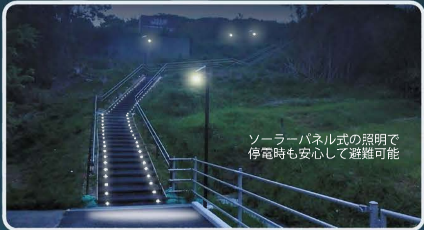
ソーラーパネル式の照明で停電時でも安心して避難可能

牧之原市において、津波被害を防ぐために整備された「高台への避難地、避難地へ向かう避難通路」の事例です。避難通路への夜間照明は、ソーラーパネル式により停電時でも心配ありません。手摺りやゴム舗装などを取り付け、災害弱者のための配慮をしています。