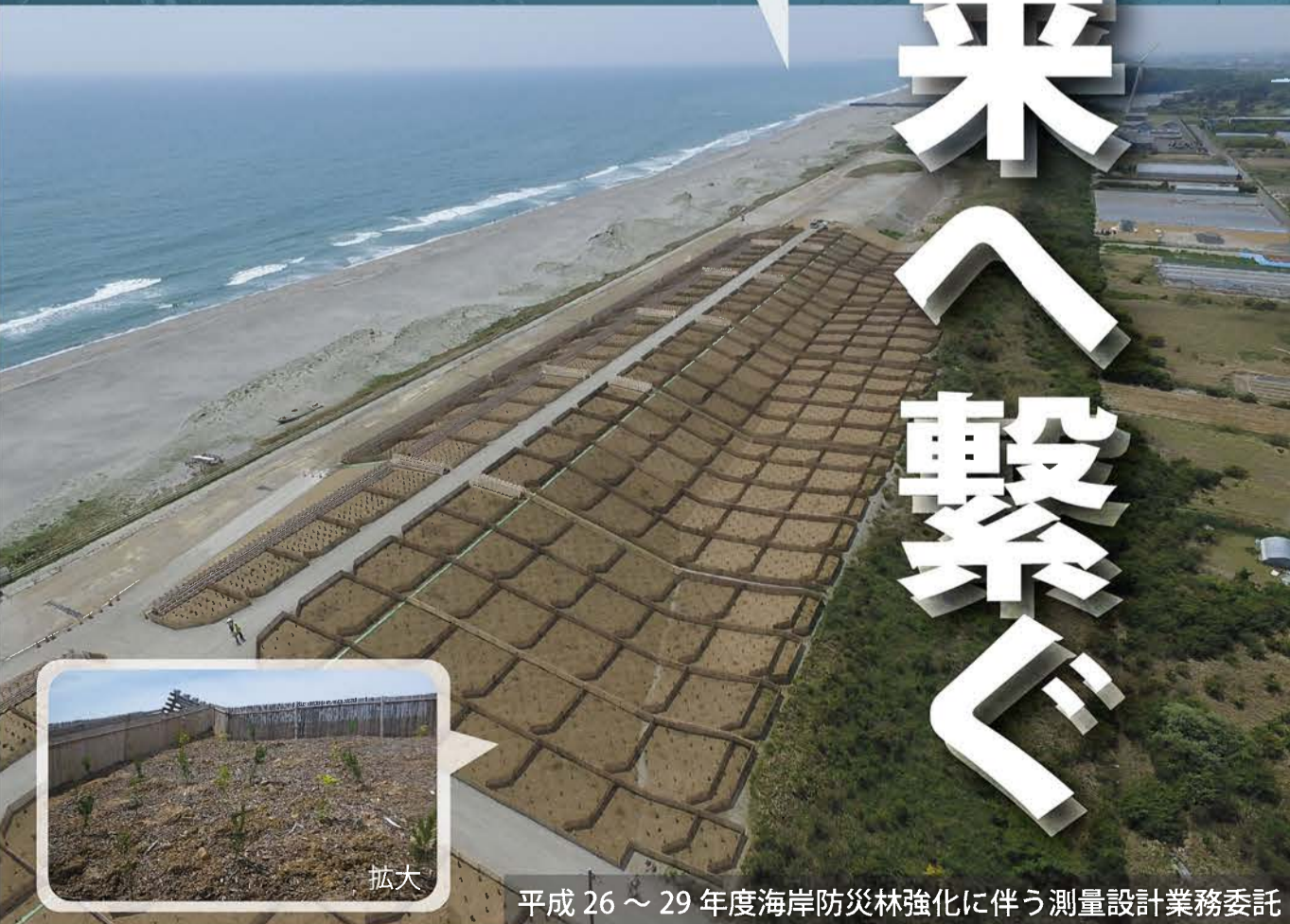
平成 26 ~ 29 年度海岸防災林強化に伴う測量設計業務委託

掛川市における海岸防災林強化事業「掛川モデル」は、海岸林の従来機能「飛砂防備」に「津波への減災」機能を備えることを目的としています。海岸線約 10 キロメートルにわたり、レベル2津波に対応した高さに海岸防災林基盤を嵩上げ盛土し、抵抗性クロマツや広葉樹を植樹して防災林を強化するもので、平成 26 年度から事業を推進しています。