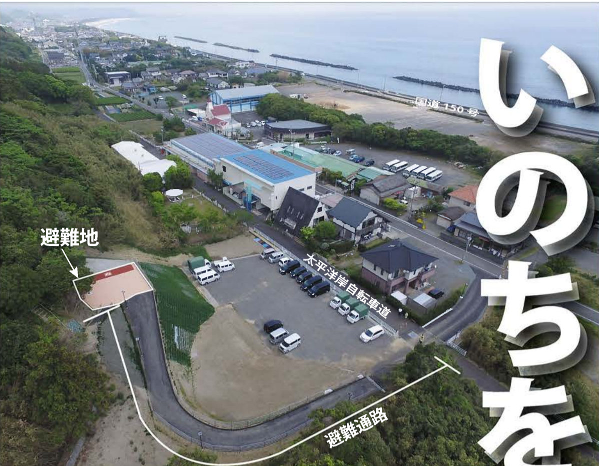
平成 27 年度都市防災総合推進事業 津波避難地測量設計用地調査等業務委託 (地頭方 4 号)